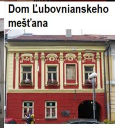
Dom Ľubovnianskeho mešťana