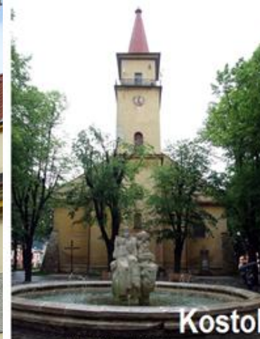
Kostol sv. Michala